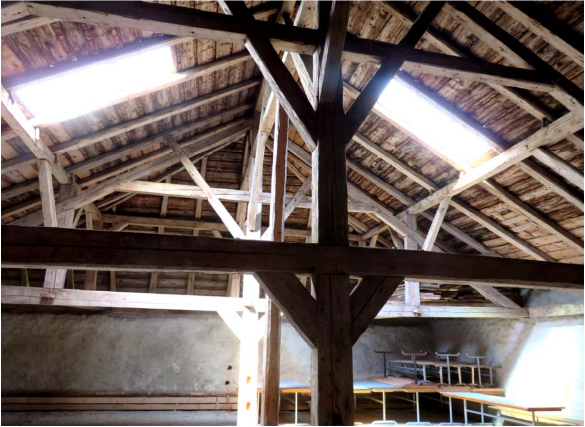
Une charpente d'un équilibre parfait. Elle est de 1791-1792.