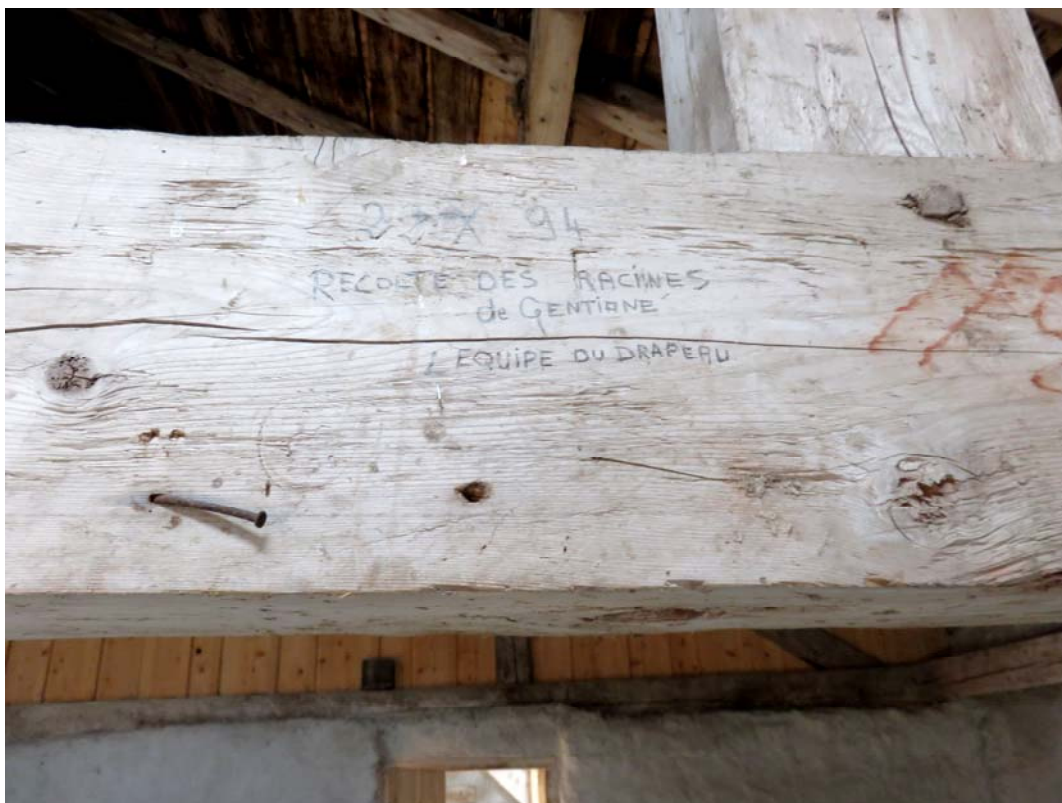
Les poutres servent aussi à témoigner de votre passage.