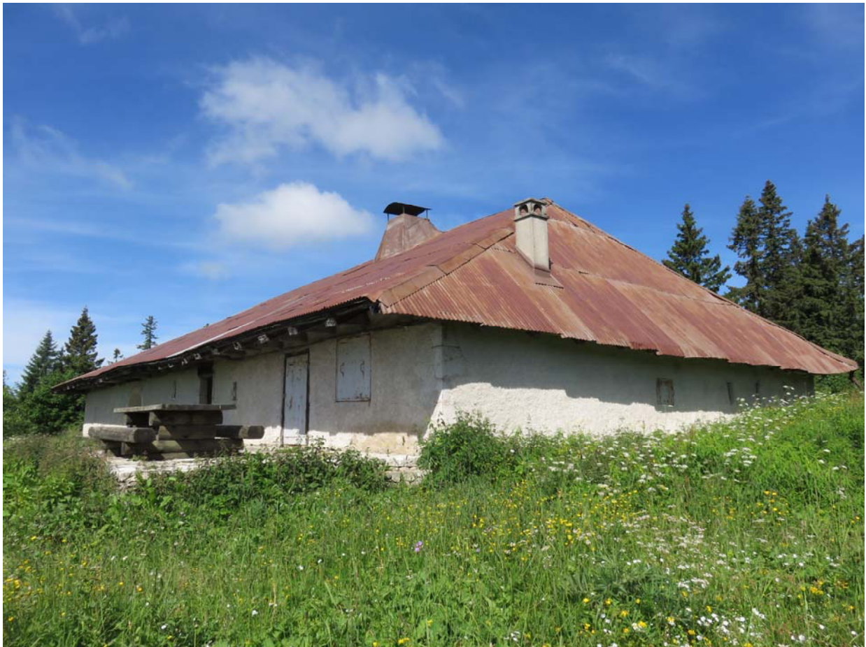
Promenade du 7 juillet 2016. Il est vrai que porte et volets métalliques ne renforcent pas l'esthétique du chalet.

Un chalet qu'il nous faudra retourner voir d'urgence. Avec en plus, là-haut, non seulement une vue superbe, mais une ambiance toute particulière.